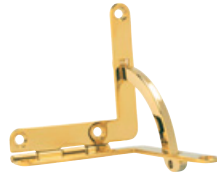
200 PVD Acier INOX 304 poli / PVD 2N Dimensions (mm): 41 x 41 x 8 Epaisseur: 1,50; arc et vis incl.