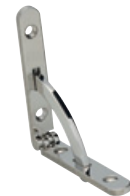
327 INOX Acier INOX 304 poli Dimensions (mm): 50 x 8 Epaisseur: 2,5; arc incl.