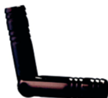
P151 PVD noir Acier INOX 316F / PVD noir Longueur (mm): 37,0 Diamètre: 5,0