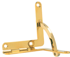
340 PVD Acier INOX 304 poli / PVD 2N Dimensions (mm): 55 x 55 x 9,0 Epaisseur: 2,0; arc et vis incl.