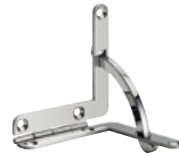
300 INOX Acier INOX 304 poli Dimensions (mm): 38 x 38 x 7,5 Epaisseur: 1,50; arc incl.