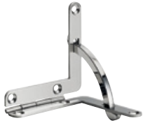
200 INOX Acier INOX 304 poli Dimensions (mm): 41 x 41 x 8 Epaisseur: 1,50; arc incl.