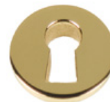
Entrée serrure à encastrer 319, dorée Acier INOX 304 poli / doré 2N Dimensions (mm): Ø 15 mm Épaisseur: 4,0 mm