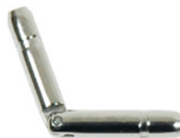
337 INOX Acier INOX 316F poli Longueur (mm): 35,0 Diamètre: 3,5