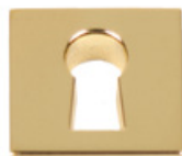
Entrée serrure rectangulaire P201G Acier INOX 304 doré Dimensions (mm): 15 x 15 x 4,5