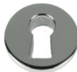
Entrée serrure à encastrer 319 Acier INOX 304 poli Dimensions (mm): Ø 15 mm Épaisseur: 4,0 mm