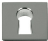
Entrée serrure rectangulaire P201 Acier INOX 304 poli Dimensions (mm): 15 x 15 x 4,5