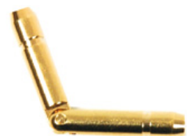
337 DORE Acier INOX 316F doré Longueur (mm): 35,0 Diamètre: 3,5

Les charnières à pivot sont destinées aux plus petits écrins. Elles nécessitent très peu de place et peuvent être montées facilement. Le modèle P151 est en acier INOX 316F poli et le revêtement PVD est également possible, sur demande.