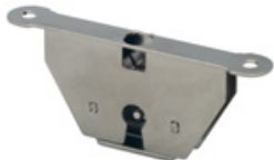
Serrure 385.01 Acier Dimensions (mm): 65 x 10 x 26,5