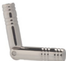
P151 Acier INOX 316F poli Longueur (mm): 37,0 Diamètre: 5,0