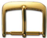
3006 DORE Acier INOX 304 poli doré Largeurs (mm): 8, 10, 12, 14, 15, 16, 18, 20, 22, 24