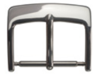
3006 INOX Acier INOX 304 poli Largeurs (mm): 8, 10, 12, 14, 15, 16, 18, 20, 22, 24