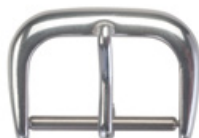
3103 Aluminium blanc Largeurs (mm): 10, 12, 14, 16, 18