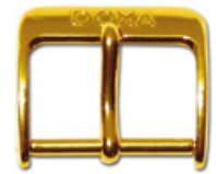
1900 OR Logo en relief