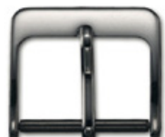
3105 Aluminium blanc Largeurs (mm): 8, 10, 12, 14, 16, 18, 20, 22, 24