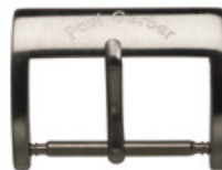
3020 INOX satiné photochimique