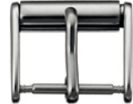
3601 INOX Acier INOX 304 poli Largeurs (mm): 14, 16, 18, 20