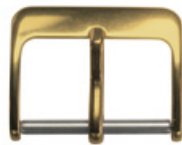
3104 Aluminium jaune Largeurs (mm): 8, 10, 12, 14, 16, 18, 20, 22, 24