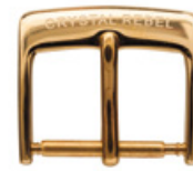
3006 PVD 2N photochimique