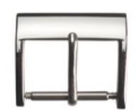
3020 INOX Acier INOX 304 poli Largeurs (mm): 14, 16, 18, 20, 22