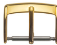
3014 DORE Acier INOX 304 poli doré Largeurs (mm): 8, 10, 12, 14, 16, 17, 18, 19, 20, 22