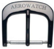
3031 PVD noir Logo en laser noir