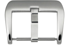
3712 INOX Acier INOX 304 poli à la main Largeurs (mm): 20, 22, 24

L'exécution dorée est toujours 0,2 my 2N.