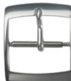
3109 Aluminium blanc Largeurs (mm): 8, 10, 12, 14, 16, 18

Les boucles en acier INOX et aluminium, également connues comme boucles-ardillon, sont nos principaux produits. Nous avons en stock différents modèles standards, en plusieurs matériaux, exécutions et largeurs. Les boucles sont toujours livrées en 3 parties, donc non assemblées, et sont livrées sur des plateaux de 50 pièces recouverts de velours, les arpillons et barrettes sont en vrac dans des sachets séparés.