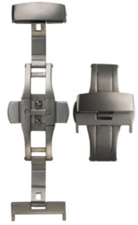
400 TITANE Titane mat, mécanisme: acier INOX 316L Largeurs (mm): 16, 18, 20, 22 Disponibilité sur demande