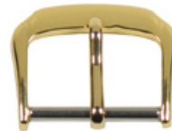
3106 Aluminium jaune Largeurs (mm): 10, 12, 14, 16, 18