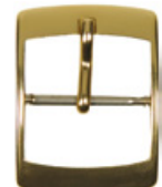
3108 Aluminium jaune Largeurs (mm): 8, 10, 12, 14, 16, 18