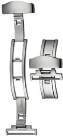
200 INOX Acier INOX 316L, poli à la main Largeurs (mm): 12, 14, 16, 18, 20, 22