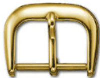
3102 Aluminium jaune Largeurs (mm): 10, 12, 14, 16, 18