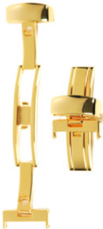
200 PVD Acier INOX 316L, PVD 2N Largeurs (mm): 12, 14, 16, 18, 20, 22