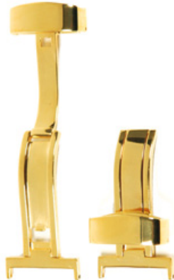
300 PVD Acier INOX 316L, PVD 2N Largeurs (mm): 10, 12, 14, 15, 16, 18, 20, 22