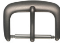
3700 TITANE Titane mat Largeurs (mm): 14, 16, 18, 20