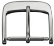
2100 INOX Acier INOX 316L poli au tonneau Largeurs (mm): 18, 20, 22, 24