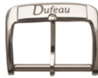
1511 INOX photochimique, noir