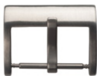
3020 INOX satiné Acier INOX 304 satiné Largeurs (mm): 14, 16, 18, 20, 22, 24, 26, 28, 30