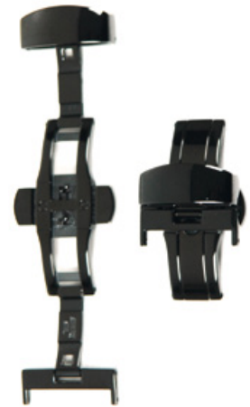
D'autres couleurs possible, sur demande

Les fermeurs ont quelques avantages comparés aux boucles-ardillon, par exemple une plus grande sécurité (la montre reste au poignet, même avec le fermoir ouvert et elle ne peut tomber par terre) ainsi qu'un confort plus grand. Le fermoir est rapidement ouvert ou fermé.