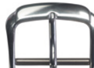
3107 Aluminium blanc Largeurs (mm): 10, 12, 14, 16, 18