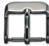
3000 INOX Acier INOX 304 poli Largeurs (mm): 14, 16, 18, 20 Certaines largeurs également disponible en exécution dorée, contactez-nous.