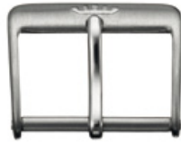
1900 INOX brossé Logo en relief