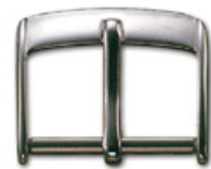
3014 INOX Acier INOX 304 poli Largeurs (mm): 8, 10, 12, 14, 16, 17, 18, 19, 20, 22