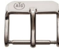
3000 INOX Logo en laser noir