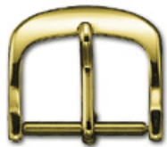
3100 Aluminium jaune Largeurs (mm): 10, 12, 14, 16, 18, 20

Les boucles peuvent être gravées au laser (blanc ou noir).