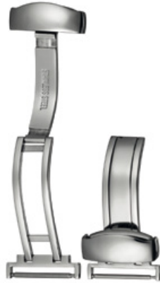
300 INOX Acier INOX 316L, poli à la main Largeurs (mm): 10, 12, 14, 15, 16, 18, 20, 22