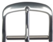
3101 Aluminium blanc Largeurs (mm): 8, 10, 12, 14, 16, 18, 20