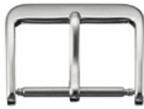
2103 INOX Acier INOX 316L poli au tonneau Largeurs (mm): 20, 22, 24, 26, 28, 30