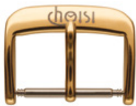
2100 PVD 2N laser noir