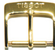
3006 PVD 2N Logo en creux (étampé)