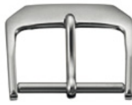
2105 INOX Acier INOX 316L poli au tonneau Largeurs (mm): 10, 12, 14, 16, 18, 20, 22