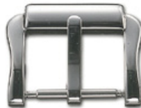
3010 INOX Acier INOX 304 poli Largeurs (mm): 16, 18, 20, 22