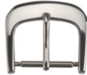
3031 INOX Acier INOX 304 poli Largeurs (mm): 12, 16, 18, 20 Certaines largeurs également disponible en exécution PVD, contactez-nous.