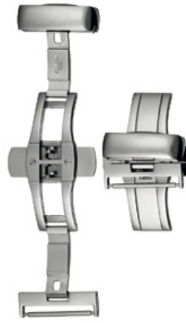
400 INOX Acier INOX 316L, poli à la main Largeurs (mm): 12, 14, 16, 18, 20, 22, 24