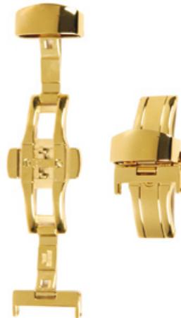
400 PVD Acier INOX 316L, PVD 2N Largeurs (mm): 12, 14, 16, 18, 20, 22, 24