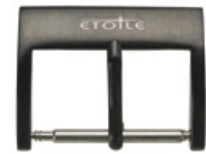
3020 PVD noir laser blanc

Votre logo ou votre marque peuvent être appliqués selon différents procédés sur la plupart des modèles et ceci déjà en petites quantités: